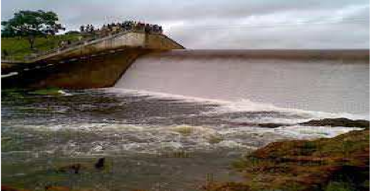
Figura 3 - Imagens da sangria do Açude de São Gonçalo-PB no dia 17/02/2011

vindos dos Estados Unidos, e inaugurado em 1932, contando com a presença de Getúlio Vargas, presidente brasileiro na época.