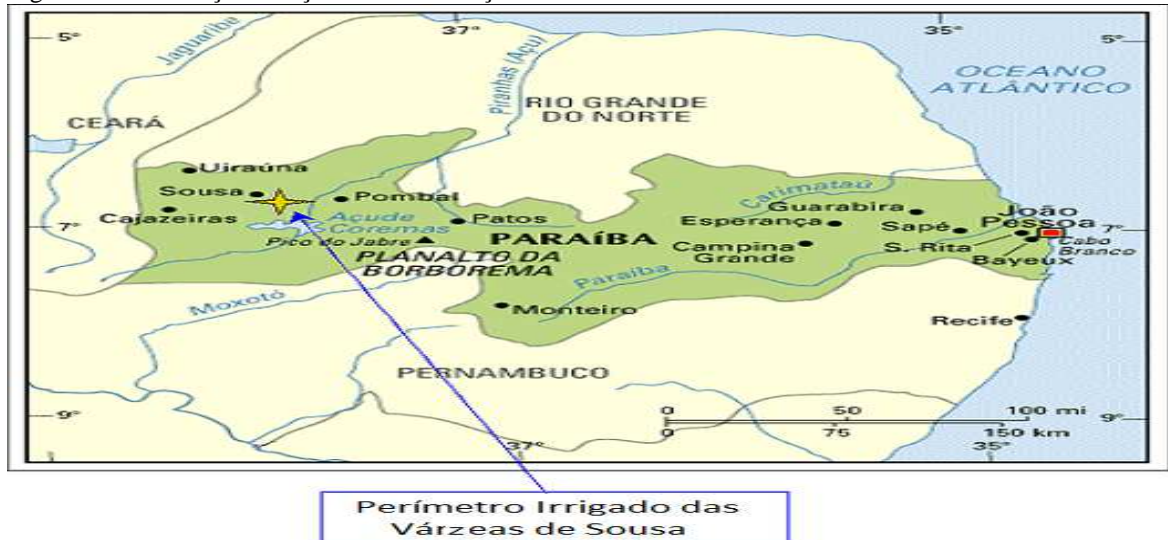
Figura 2- Localização do açude de São Gonçalo – PB